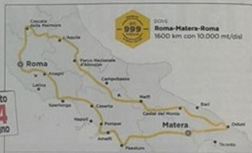
Sopra, la mappa della 999 Miglia. A sinistra, il bianco borgo di Ostuni

ter allargare il numero dei partecipanti, che era stato inizialmente