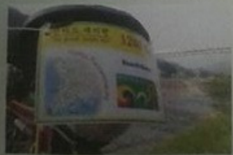
Si correrà anche in Corea del Sud.

Oltre alla Trans O2, alla Londra-Edimburgo-Londra e alle due importanti prove in programma quest'anno in Italia (999 Miglia e Parov-Brema-Parov), il calendario internazionale 2017 propone decine di eventi, da gennaio a novembre, in ogni parte del mondo. La maggior parte si disputa sulla classica distanza di 1.200 chilometri. C'è un sorprendente fiorire di manifestazioni in India e in Russia. Spiccano a metà giugno una 1.400 chilometri in Grecia e a settembre la Paris-Amburgo. Ecco una selezione dei più importanti appuntamenti in programma nel 2017.