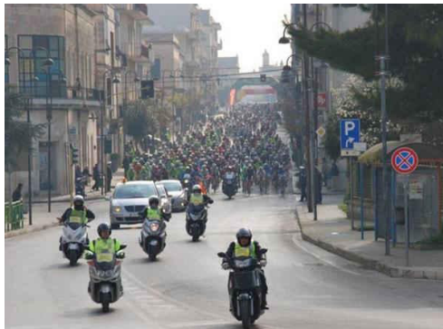
La partenza dell'edizione 2017